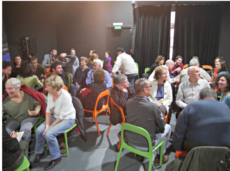
Cercles de paroles en dernière partie de conférence Bibliothèque intercommunale de Riom – novembre 2015

« Cette réflexion sur le temps et la conso m'est propre depuis longtemps, cela m'a confortée, je me sens moins seule ! »